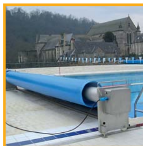
COUVERTURES POUR PISCINES